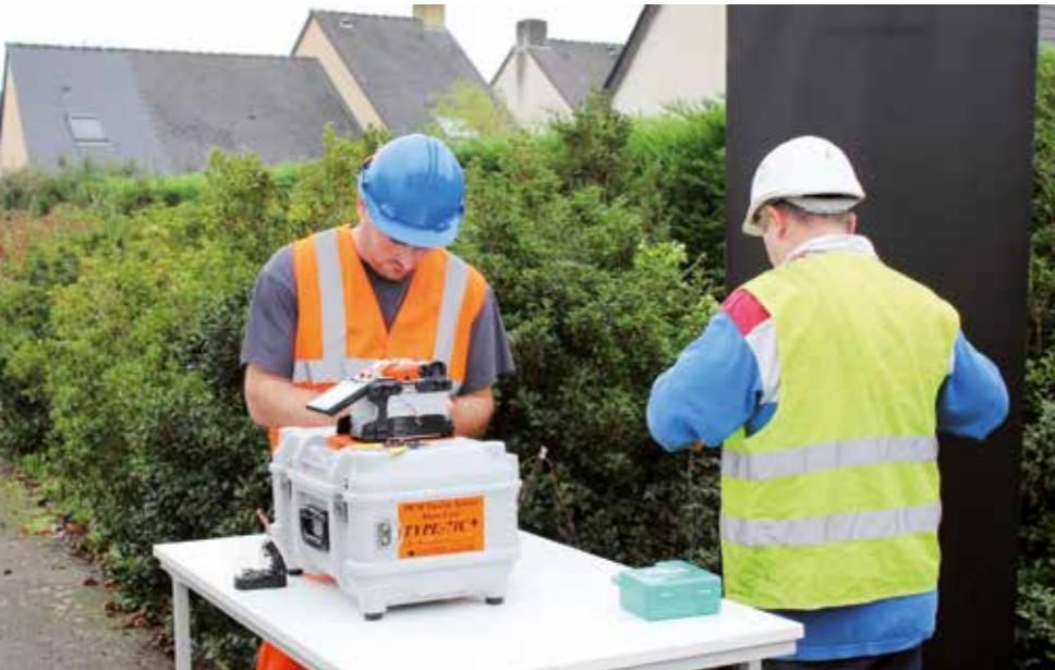
La fibre se déploie actuellement sur la commune.

Le déploiement de la fibre optique sur l'ensemble de la commune doit être terminé par l'opérateur Orange en 2020. Rue après rue, les travaux se déroulent pour le plus grand plaisir de ceux qui utilisent régulièrement Internet.