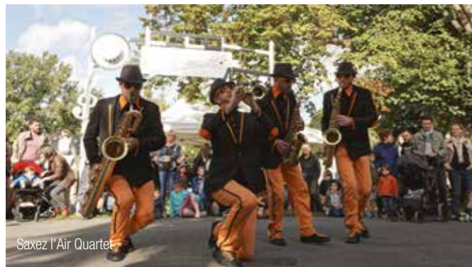
SaxeZ l'Air Quartet