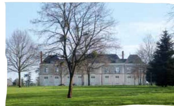
Le Château de l'Hopitau

La construction du château daterait du XVIII e siècle. À la Révolution, le domaine appartient à la famille Hervé de la Bauche, membre du Conseil municipal dans les années 1820. En 1793, le domaine devient un bien national quand la famille est arrêtée et emprisonnée. À l'issue de cette période révolutionnaire, la famille rachète le château. La propriété de l'hôpital comprend le château, le parc et deux fermes. Ces bâtiments sont représentatifs du patrimoine rural chapelain. Une longère formée de la pièce à vivre et de la chambre à coucher, puis l'étable ou l'écurie. Au-dessus se trouvent les greniers pour le stockage des grains et des fourrages, accessibles par des lucarnes meunières. Ces bâtiments sont aujourd'hui réaménagés et mis à la disposition d'associations chapelaines.