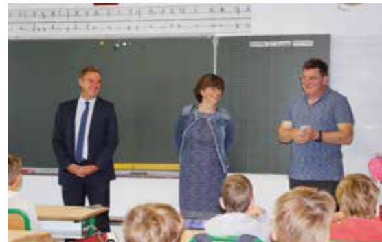
La rentrée s'est déroulée dans la joie et la bonne humeur pour les 2 036 écoliers chapelains.

À l'école élémentaire de Mazaire, un ascenseur destiné aux Personnes à Mobilité Réduite et une rampe d'accès ont été mis en place. Une partie de l'enrobé du terrain de basket a été refait. À l'école maternelle de La Blanchetière, un nouveau module a été associé à l'ancien, afin de créer une nouvelle salle de sieste et ainsi répondre à l'augmentation des effectifs d'enfants à l'école et à l'accueil de loisirs (mutualisation du dortoir). Des travaux de peinture et de réfection des sols ont également été réalisés aux écoles Beausoleil et Doisneau.