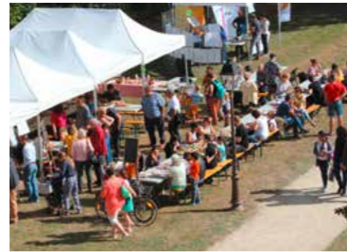
La prochaine édition du Petit Dej' Chapelain aura lieu le 7 octobre prochain (lire encadré).

Du côté de la Ville, le Maire affiche clairement sa volonté : « L'agriculture doit se développer sur le territoire. La Chapelle-sur-Erdre a un passé rural qui forge son identité. Les agriculteurs chapelains sont dynamiques et soucieux de l'écologie. L'agriculture doit être un des piliers pour construire l'avenir de la commune ». La collectivité est déjà passée à l'acte. « C'est sûr qu'avec l'inscription dans le PEAN (périmètre de protection d'espaces agricoles et naturels), le rachat de La Noue Verrière ou l'aménagement foncier, l'équipe