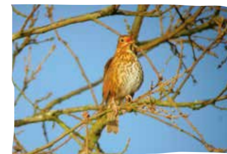
La grive musicienne