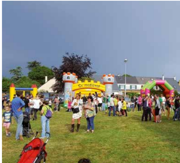
2 000 personnes se sont déplacées pour participer à la première édition du festival West'Erdre