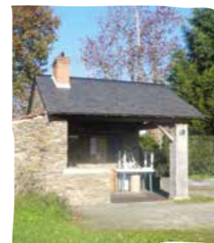
Le four du village des Cahéaux