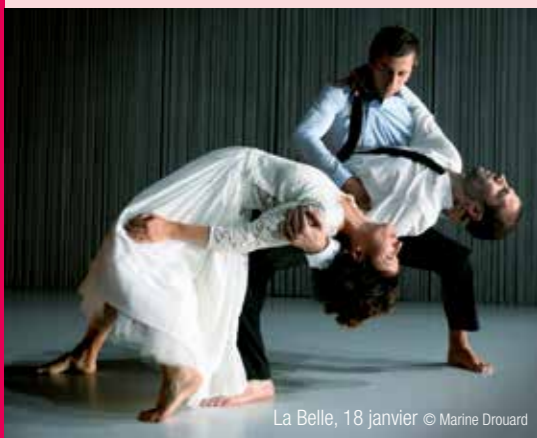
La Belle, 18 janvier

Lundi 26 novembre RÉUNION DE PRÉSENTATION DU NOUVEL ESPACE FAMILLES de 18h30 à 19h30 à l'école La Blanchetière