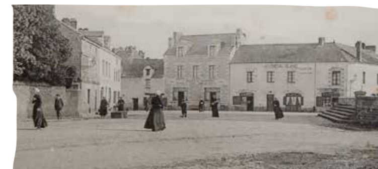
Place de l'église