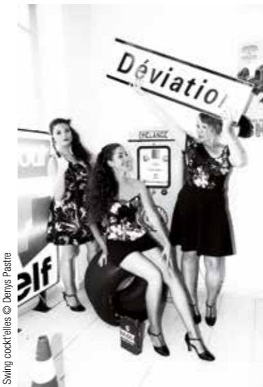
Swing cocktails

L'année 2019 commencera sous le signe des festivités pour nos retraités chapelains. Les personnes de plus de 68 ans sont invitées à participer à la fête des retraités. Comme tous les ans, le choix se fait parmi quatre propositions : un repas dansant le dimanche 3 février ; un concert de musique classique le vendredi 29 mars ; un spectacle musical le dimanche 31 mars ou encore une pièce de théâtre le jeudi 4 avril.