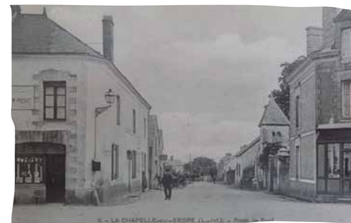
Rue Louise Michel (ancienne route de Sucé)