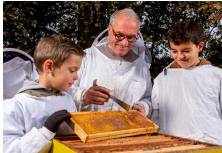
La Chapelle-sur-Erdre compte une quinzaine d'apiculteurs amateurs.