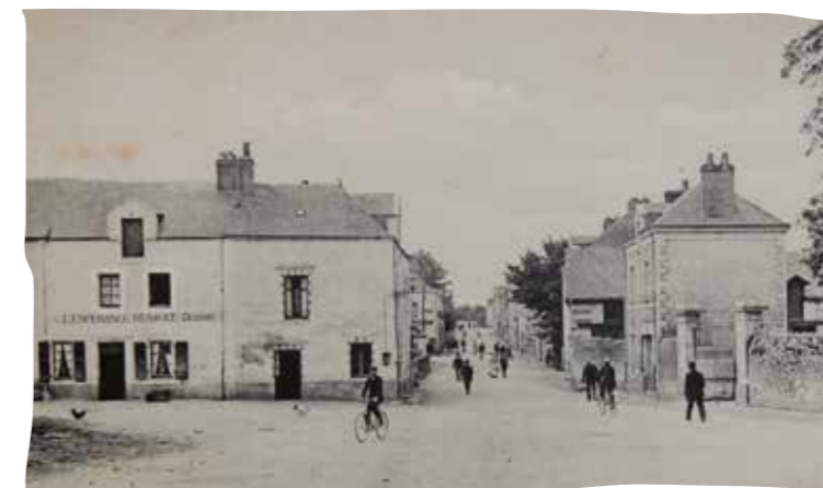
Place de l'église et rue Martin Luther King (ancienne route de Nantes)

Cet article a été réalisé en partenariat avec l'association Au Pas des Siècles.