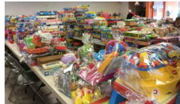
L'association fête ses 30 ans en fin d'année, entourée de ses bénévoles et de ses partenaires.

L'aventure Noël Pour Tous a démarré en 1985, lorsque deux mamans chapelaines ont décidé de donner une seconde vie aux jouets de leurs enfants. Leur initiative s'est répétée quatre années de suite et face au succès rencontré, l'association Noël Pour Tous a été officiellement créée en 1989. Depuis, les visages ont changé, les bénévoles sont de plus en plus nombreux, mais une chose reste fidèle à l'idée première : donner une seconde vie aux jouets, et faire plaisir aux enfants.