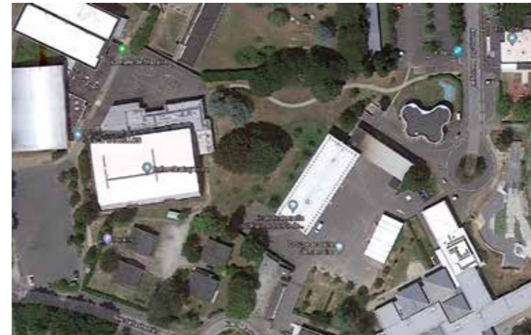
La Ville lancera le projet de Réseau de chaleur technique sur le secteur de Mazaire. Un projet pour limiter l'utilisation des énergies fossiles.

000 euros). L'animation de La Chapelle-sur-Erdre est un élément fondamental du lien social et du bien vivre ensemble. La qualité du tissu associatif chapelain est une chance pour la commune et la Ville souhaite lui permettre de continuer à s'épanouir en lui mettant à disposition des infrastructures de qualité. Ainsi, les études de programmation du stade Bourgoin Decombe vont être lancées (45 000 euros) ainsi que celles de l'évolution du complexe de la Coutancière (25 000 euros). Les travaux de l'Hopital et de Jacques Demy, entamés en 2018 vont se poursuivre, au bénéfice des associations de théâtre, afin de construire un lieu référent autour des arts de la marionnette et du spectacle vivant (166 000 euros). A Capelia, ce sera la fin des travaux de la salle Piaf (287 000 euros). Enfin, les études de programmation vont être lancées pour la construction d'un équipement aux Perrières.