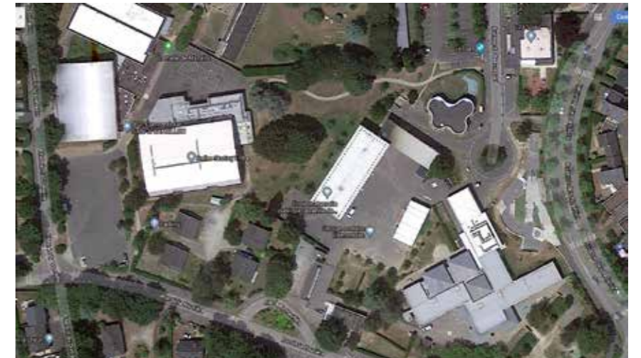
Un projet co-financé par la Ville, le Conseil départemental et l'ADEME.

La chaufferie bois d'une puissance de 1064kW sera hébergée dans un futur bâtiment de 115m 2 situé sur un terrain public.