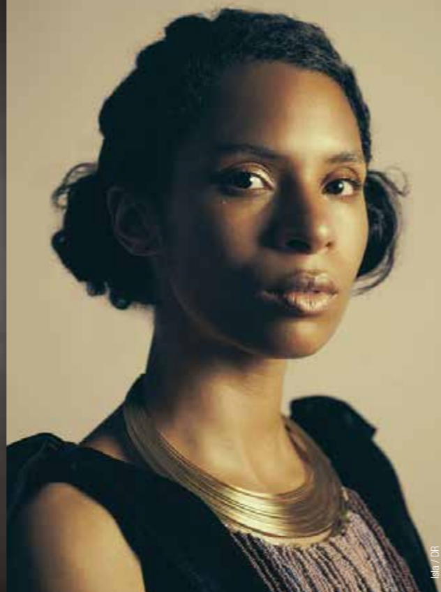
Isla / DR