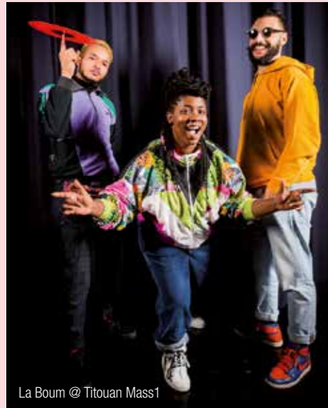
La Boum