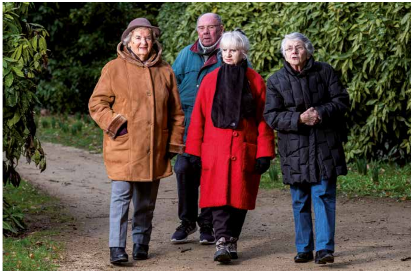
Un chapelain sur 4 a plus de 60 ans. Une évolution démographique que La Chapelle-sur-Erdre et Nantes Métropole veulent accompagner et adaptant la ville, notamment s'agissant des logements

Trois logements sont également disponibles au domicile services de L'Orée du Plessis. Il s'agit d'appartements non meublés et adaptés avec des loyers abordables, une redevance services est demandée afin de bénéficier d'un espace commun et de services (animations, restauration, permanence téléphonique de nuit, aide administrative, soutien matériel, moral et relationnel...). Renseignements : 02 40 72 49 12 - mr.oreduplessis@gmail.com