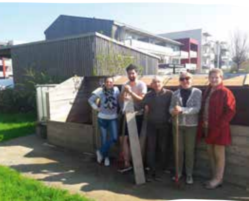
Les bénévoles du composteur du quartier des Perrières 2.

La Ville de La Chapelle-sur-Erdre compte cinq composteurs partagés, animés et gérés par les habitants. Le 6 avril prochain, venez à leur rencontre à l'occasion du « Compostour », une balade de 5 km à la découverte des composteurs, de leur fonctionnement et de leur histoire.