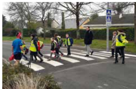
Le 20 mars, 17 enfants et leurs 7 accompagnateurs ont inauguré le pédibus.

Initié par l'Amicale Laïque de Gesvrine et l'Association pour l'Intérêt des Élèves (APIE), le projet de pédibus du pôle éducatif Robert Doisneau a démarré le mercredi 20 mars.