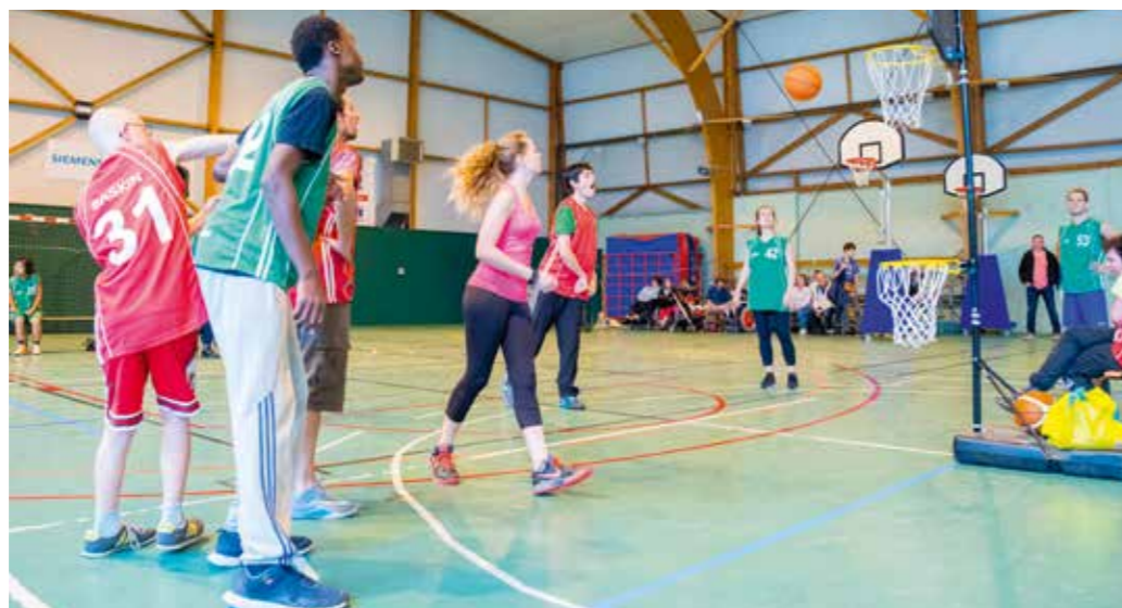
La nouvelle édition de Handi'Chap aura lieu le 25 mai.

Parallèlement, un site internet accessible a été développé. Retrouvez toute l'information de la Ville à destination des déficients visuels : www.lachapellesurerdre.voxiweb.net