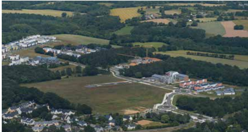
Le futur PLUm respectera l'identité du centre-ville et des villages de La Chapelle-sur-Erdre.

Nantes Métropole votera vendredi 5 avril la mise en œuvre du Plan Local d'Urbanisme métropolitain. Un document stratégique d'aménagement de la commune qui a fait l'objet d'une longue concertation.