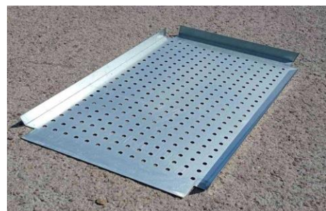
Exemple de grille spéciale Composteurs