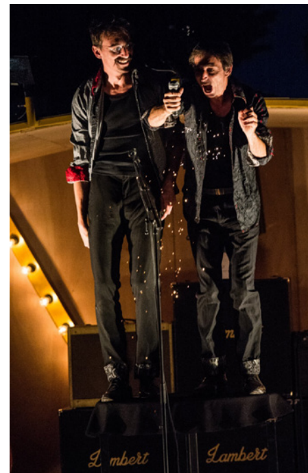
Titre définitif* [*Titre provisoire]

On retrouvera le groupe chapelain de percussions brésiliennes dit aussi «Batucada» à l'occasion de deux déambulations !