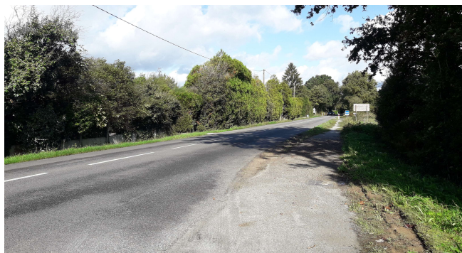
Busage Bitaudais et Poignardière