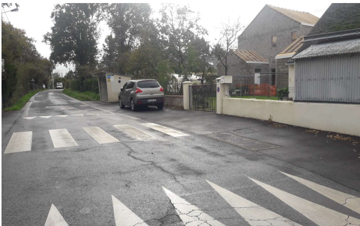
Abri-bus de la Gergaudière : reprise de l'accotement en enrobé