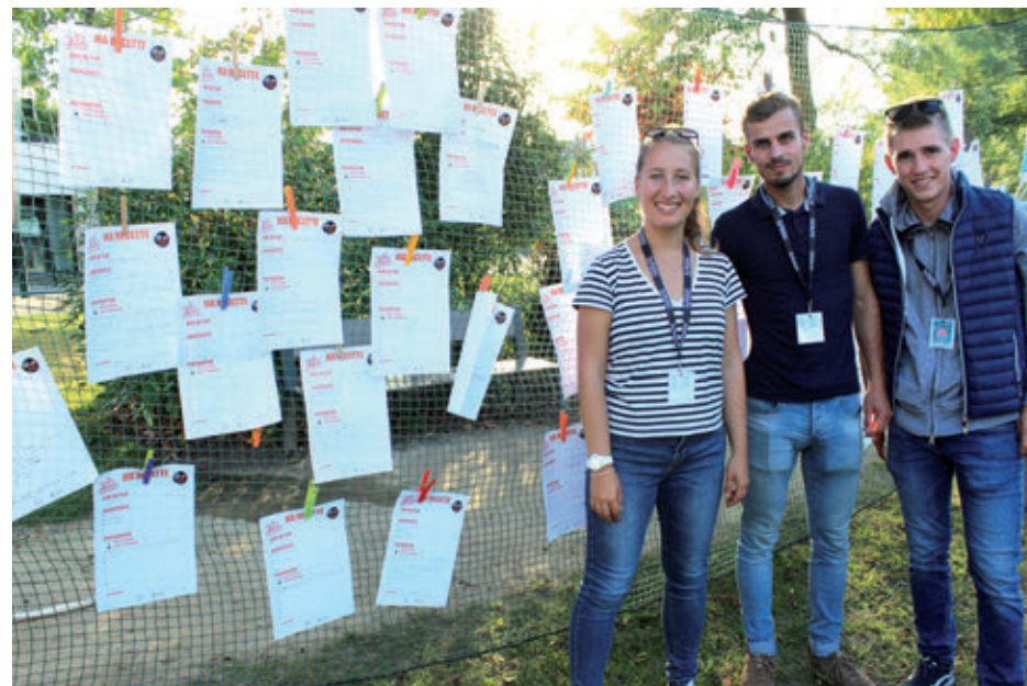
Les Chapelains ont partagé leurs recettes sur un mur créé lors de La Ville aux enfants.

À la fin de l'été, lors de La Ville aux enfants, plusieurs animations ont éveillé les papilles des Chapelains : un mur de recettes, un atelier cuisine saine et zéro-gaspi, un marché fermier et la fabrication de fouées chapelaines. Décembre est l'occasion d'annoncer de nouvelles actions culinaires et de partager de bonnes recettes.