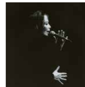
Juliette Gréco – 2000