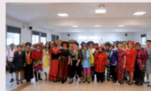
Le bal costumé aura lieu le 23 mars, à 14h15, salle Jean Jaurès. Ouvert à tous. 6,50 €/personne avec viennoiserie offerte.