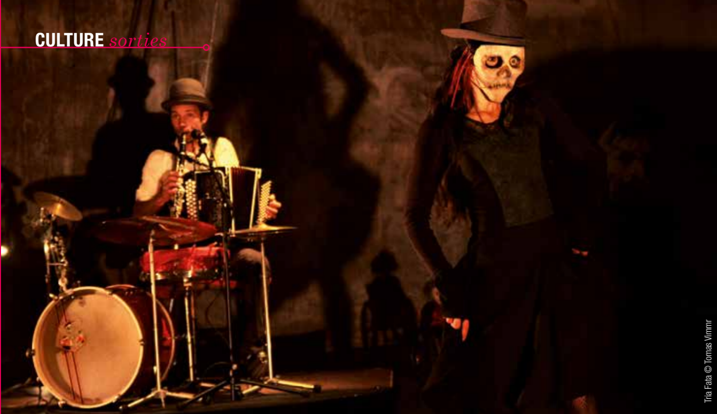
Tria Fata © Tomas Vimmer