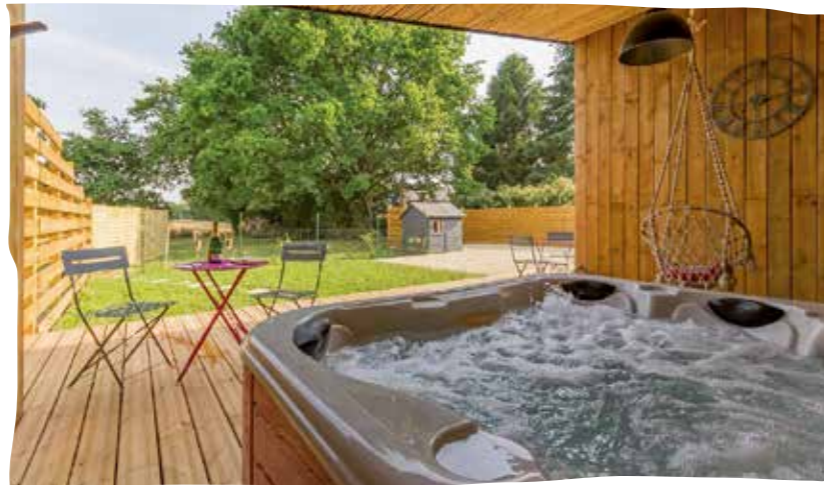
De Pierres et de Plumes

Situé au cœur du quartier de la Gandonnière, au bord de l'Erdre, l'Albizia et Le Charme, deux gîtes mitoyens, ont été aménagés dans