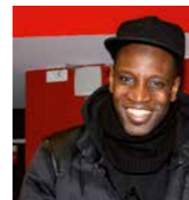
Abd Al Malik – 2008 – 2016