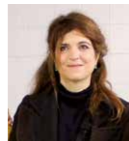
Agnès Jaoui – 2007 – 2015