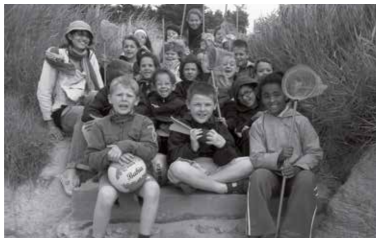
Les jeunes chapelains ayant participé aux séjours proposés par la Ville pourront retrouver quelques souvenirs à l'occasion de cette exposition.

Afin de fêter ces dix années, une exposition de photographies intitulée « J'ai dix ans... » retraçant les plus belles expériences vécues et les plus beaux moments de loisirs sera à découvrir du 14 au 24 mars à l'espace culturel Capellia. Dans une ambiance qui se voudra sans doute quelque peu nostalgique, il sera proposé aux jeunes adultes de se reconnaître sur les clichés et de « tagger » leur prénom et leur nom près de leur visage.