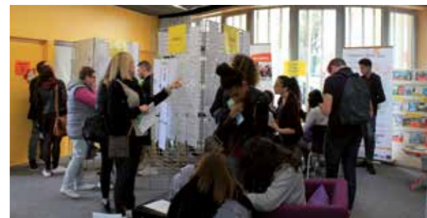
La 16 e édition se déroulera le samedi 10 mars au PIJ.

Comme lors de la précédente édition, la Ville recrutera ses animateurs et animatrices pour l'été à l'occasion d'un « speed anim ». Si le secteur de l'animation vous intéresse, n'hésitez pas à candidater avant le 2 mars