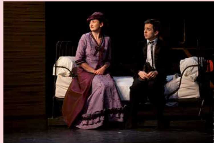
Le Cercle des Illusionnistes, le 14 fév. à l'espace culturel Capellia. Cette pièce a reçu cinq nominations et trois Molières : Meilleure mise en scène, Meilleur auteur, Révélation féminine