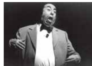
Raymond Devos – 1997

Dominique Barranguet revient sur les 16 saisons culturelles qu'il a programmées à l'espace culturel Capellia. "Comme c'est encore le cas aujourd'hui, les choix de programmation étaient éclectiques avec la volonté de croiser les Arts. Aux côtés de Pierre Sécher, adjoint à la Culture, nous avons essayé de satisfaire le public qui était d'abord chapelain et très vite nantais et des communes limitrophes. Au fil des saisons, le nombre de spectacles a considérablement augmenté. J'ai de très beaux souvenirs comme la partie de pétanque jouée avec Pierre Perret sur le parking de l'espace culturel Capellia ou encore d'avoir cuisiné pour Jean-Marie Bigard qui avait un petit creux en milieu d'après-midi. Raymond Devos, que l'on avait accueilli trois jours successifs nous a fait la surprise d'offrir un pot d'amitié à toute l'équipe suivi d'un concert privé en off qui relatait ses débuts avec Brel et Brassens. Mon seul regret serait de ne pas avoir pu programmer Michel Jonasz. Aujourd'hui, je suis encore très ému de voir que l'équipe administrative et technique de l'espace culturel Capellia que j'avais recrutée est toujours ici, fidèle à ce lieu et à son projet culturel. En 1988, cette aventure était nouvelle et osée mais elle a pu se réaliser grâce à la confiance que m'avait accordée l'équipe municipale.