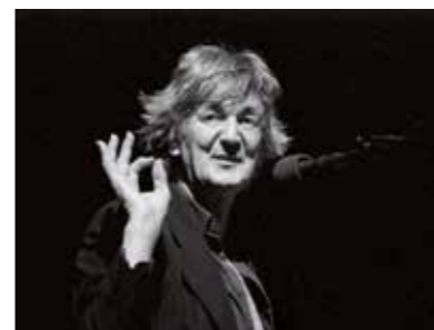
Jacques Higelin 2000 – 2006