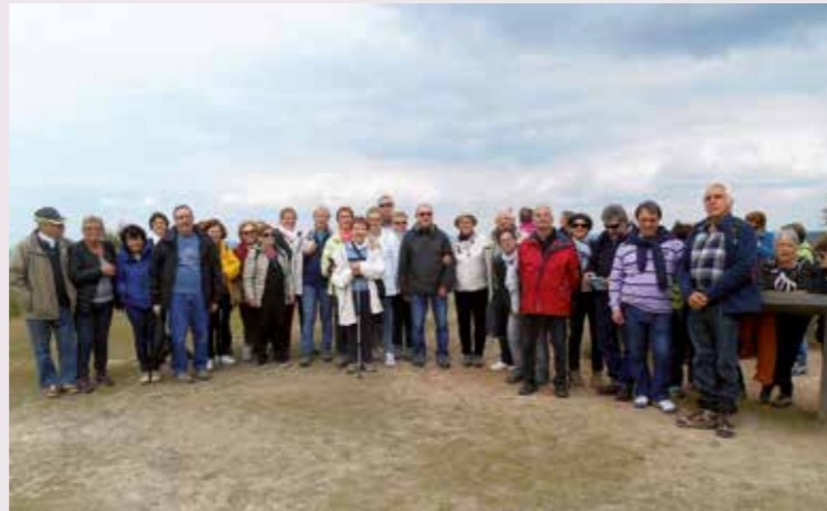
Les grandes marches ont lieu les 1 er et 3 e mardi de chaque mois. La prochaine aura lieu le 6 février. Départ 14h15, derrière l'église.