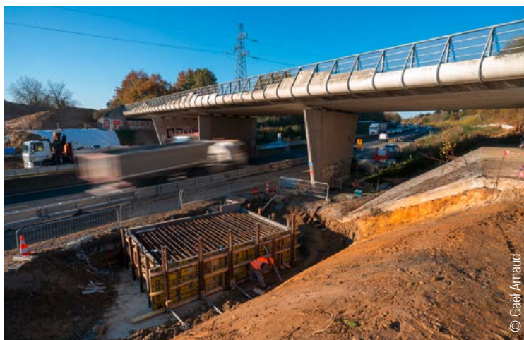
Le pont provisoire sera opérationnel début avril.