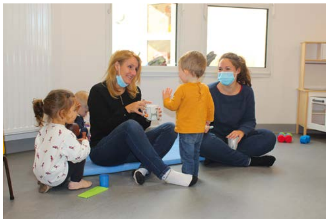
"La Bulle d'Air" accueille parents et enfants, sans inscription, le lundi, en période scolaire, de 9h à 12h.

Ouvert en novembre 2018, le Lieu d'Accueil Enfants Parents (LAEP) de La Chapelle-sur-Erdre porte désormais le nom de "La Bulle d'Air". Tout un symbole pour les accueillants qui ont trouvé ce patronyme évocateur.