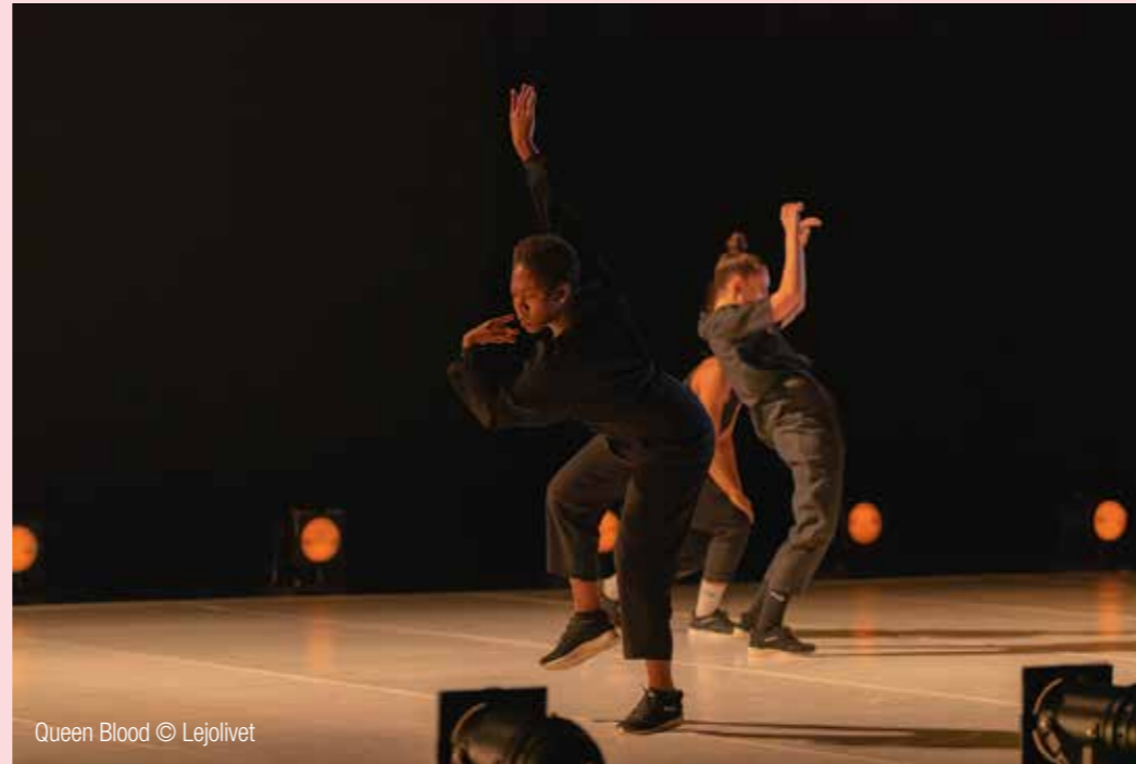
Queen Blood

À 20h30, Capellia Musique classique www.capellia.fr