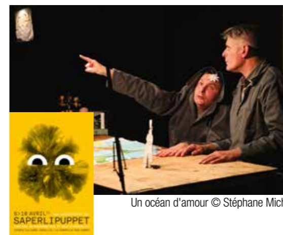
Un océan d'amour © Stéphane Michel