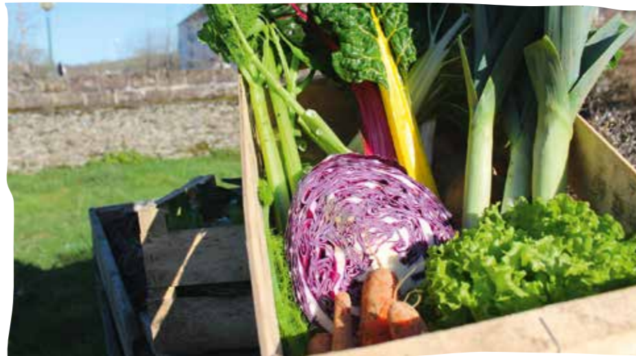
Pommes de terre, carottes, poireaux, chou, blettes multicolores... Le panier de l'AMAP de la ferme des Faillis Marais regorge de couleurs et de vitamines au cœur de l'hiver.

Pour rappel, le principe des AMAP réside en un partenariat paysans-consommateurs. Le sigle AMAP signifie Association de Maintien de l'Agriculture Paysanne. En effet, les adhérents s'engagent dans un contrat de six mois ou un an, selon les AMAP et/ou les produits, et les paniers sont à payer d'avance. Cet achat en amont de tout ou partie de la production permet de soutenir l'agriculture locale et les circuits courts, et met une alimentation de qualité à portée de tous