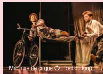
Machine de cirque © L'œil du loup