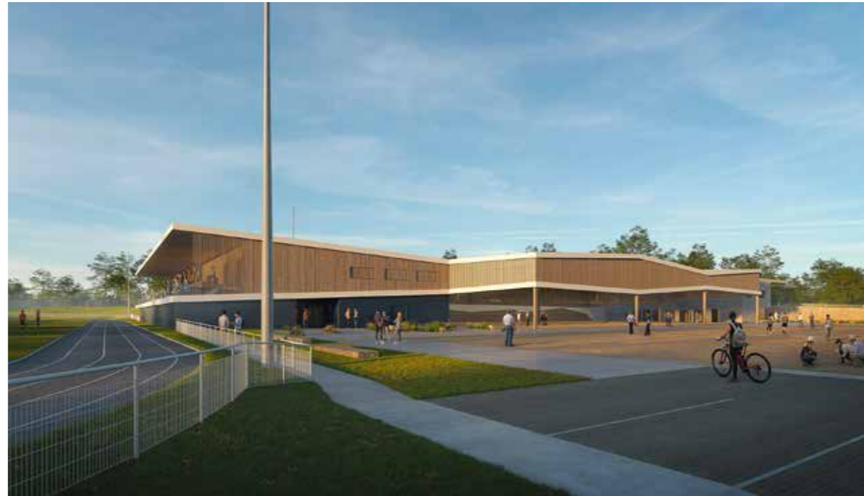
En 2022 les travaux de réhabilitation du complexe sportif Bourgoin-Decombe seront lancés.

L'économie est, elle aussi, au diapason de cette politique écologique, notamment par la volonté d'accueillir sur le futur parc de la Métairie Rouge des entreprises engagées fortement dans la responsabilité sociétale ou encore dans l'économie sociale et solidaire.